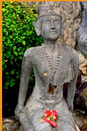
Para Malestar de Hombro

Un estudio reciente en la Universidad Naresuan, en Phitsanulok, Tailandia, encontró que luego de un mes de práctica regular de Reusi Dat Ton existía una mejoría en la performance durante ejercicios anaeróbicos en mujeres sedentarias. (Weerapong et al, 205)