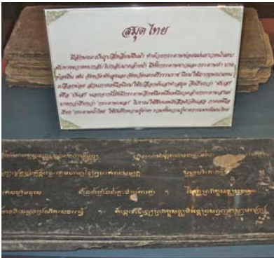
Reusis de Prasat Phnom Rung

En las afueras de Bangkok, en el pueblo de Samut Prakan, está el parte cultural, en la Ciudad Antigua de “Muang Boran”.