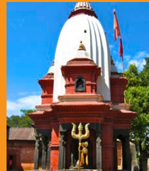
Templo Pasupata. Nepal

Yogadaksinamurti. De acuerdo al Departamento de Bellas Artes "Yogadaksinamurti significa Shiva en la forma del supremo asceta, quien da y mantiene la sabiduría, la percepción, la concentración, el ascetismo, la filosofía, la música y la habilidad