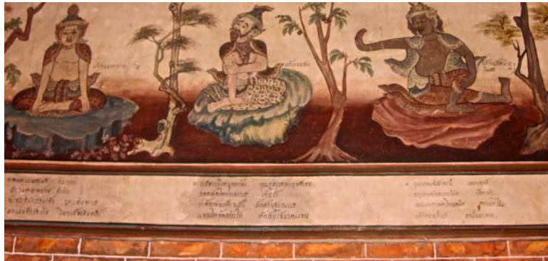
Mural de Reusi Dat Ton en Wat Machimawat

Una de las muchas atracciones es la “Sala de los 80 Yogis”, que exhibe 80 estatuas de Reusis en tamaño natural, mostrando varias técnicas de Reusi Dat Ton. Inclusive hay representaciones de técnicas de Reusi Dat Ton que no se encuentran en ninguno de los dos textos de Wat Po. Mientras que la mayoría de estas estatuas son muestras bastante exactas de técnicas de Reusi Dat Ton, algunas muestran técnicas de Hata Yoga indiano, que no son parte del sistema de Reusi Dat Ton.