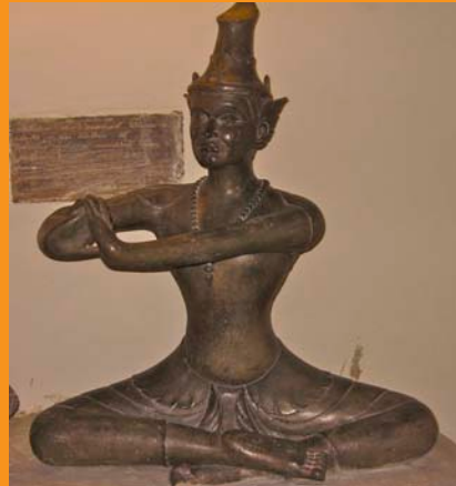
Nueva Estatua de Reusi Dat Ton con Poema, Wat Po