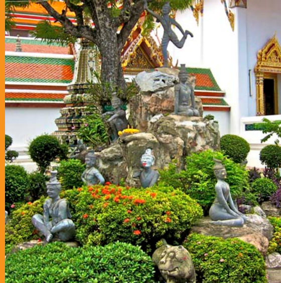
La Montaña del Eremita, Wat Po