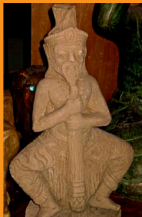
Para Calambres de Pies & Longevidad