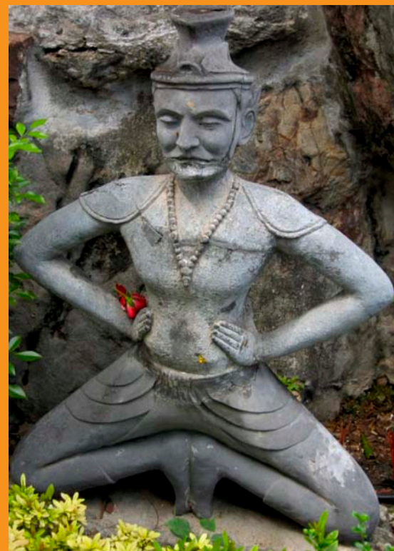
Estatuas de Reusi Dat Ton en Wat Po