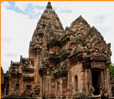
Prasat Phnom Rung

En 1767, los ejércitos armados burmeses destruyeron la antigua capital tailandesa de Ayutthaya. Al poco tiempo de su coronación en 1782, el rey Rama I estableció una nueva capital en lo que hoy es