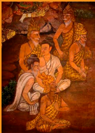
Reusis en Wat Pra Kaew, Bangkok

Si esta tendencia continúa, se corre el peligro de que el Reusi Dat Ton se diluya y distorsione como le está ocurriendo al Hatha Yoga en la cultura popular actual. Hoy podemos estar viendo a la última generación de profesores con una conexión viva a las tradiciones ancestrales del pasado y con quienes son capaces de transmitir las auténticas enseñanzas del Reusi Dat Ton. Los estudiantes de Reusi Dat Ton harían bien en buscar actuales Reusis que hayan aprendido de Reusis mayores que sirven como un puente vivo al linaje de esta ancestral tradición.