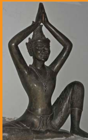
Para Dolor de Cabeza