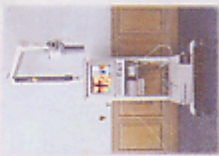
Radio Visio Graphy machine

ด้วยระบบบันทึกข้อมูลและ ภาพสีในจอคอมพิวเตอร์ ทันตแพทย์และผู้ช่วย สามารถทราบผลได้ทันที และพิมพ์ ออกมาเป็นภาพสีได้ทุกรูปที่ผิดปกติ และ ในการตรวจราก ฟัน สามารถเห็นได้ทุกส่วนของขากรรไกรขาบน และ ฟันที่ ผิดปกติในขากรรไกร